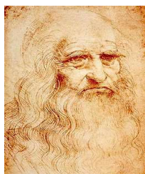
Léonard de Vinci

Il reste quelques places dans le car pour Amboise. N'hésitez pas à vous inscrire et à inviter vos amis pour les faire profiter de cette journée chez Léonard.